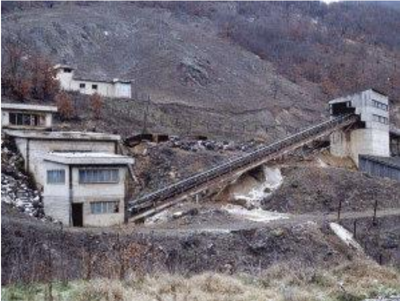
Auf einem Bergwerk in Harnai in der Provinz Khyber Pakhtunkhawa / Pakistan starben zwei Bergleute durch Gasvergiftung.