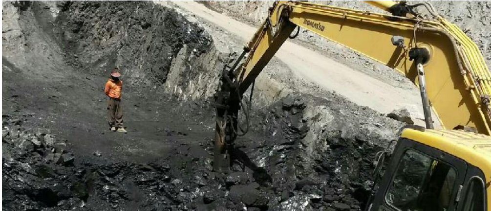
Abbau von Gilsonit

Förderung eingestellt. Das Mineral wird zur Herstellung von mehr als 160 Produkten eingesetzt.