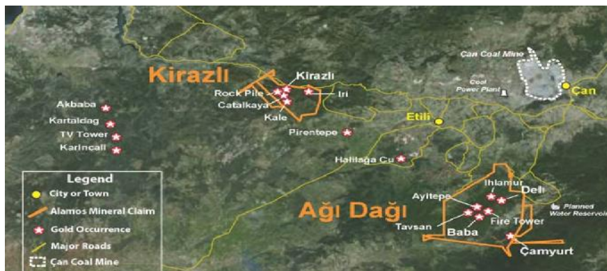
Goldfelder um Kirazli

Die kanadische Alamos Gold hat von der Forstbehörde grünes Licht zum Bau des Goldtagebaus Kirazli erhalten. Das Unternehmen rechnet mit Investitionen von 170 Mio. USD und mit dem Förderbeginn in 2018. Über einen Zeitraum von fünf Jahren sollen jährlich 99.000 Unzen produziert werden.