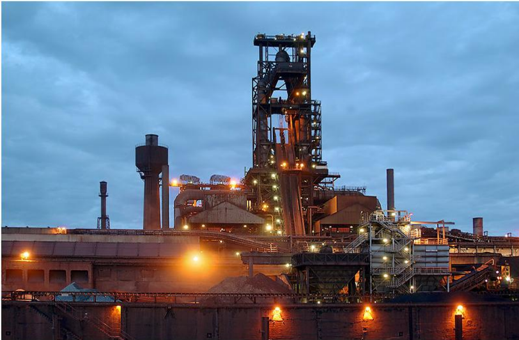
HKM Hochofen B