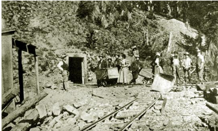
Gold Hill Mining District August 1900

Tahoe Resources Inc. hat 2016 insgesamt 21.3 Mio. Unzen Silber und 385.111 Unzen Gold produziert. Das Unternehmen betreibt das Bergwerk Escobal in Guatemala, die beiden Goldtagebaue La Arena und Shahuindo in Peru und die beiden Bergwerke Timmins West und Bell - Creek in Kanada.