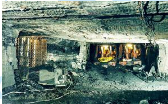
Mobile Roof Supports

Ein Wassereintritt aus dem Bergwerk Sibirskaia der insolventen Carlit Investments Limited (registriert in Zypern) hat auf dem Bergwerk Oktjabrskaja der Bergbaugesellschaft Saretschnaja die Förderung zum Erliegen gebracht und bis jetzt einen Schaden von mindestens 2,2 Mio. Euro verursacht.