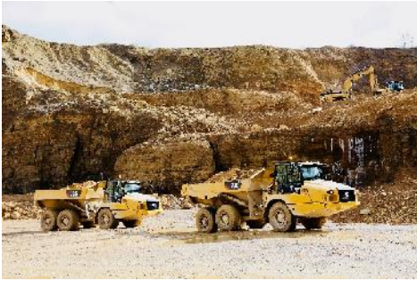
CAT D735 und 730