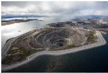
Die alten Tagebaue

Rio Tinto Copper & Diamonds und Dominion Diamond Corporation haben den vierten Diamantentagebau in Diavik am Lac de Gras in Förderung genommen. Die Tagebaue gingen 2003 in Förderung. Seit ihrer Erschöpfung 2012 werden die Diamanten untertägig im Bergwerk gewonnen.