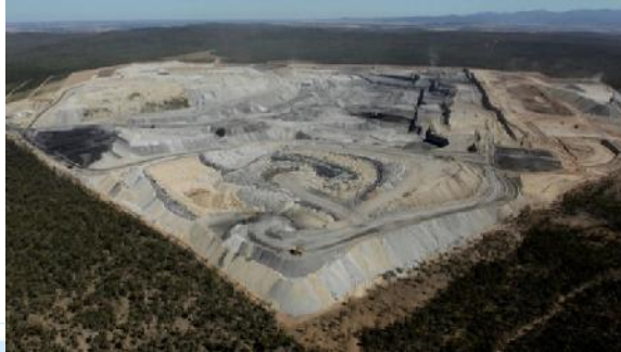
Tagebau Maules Creek