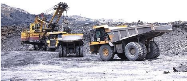
Steinkohletagebau Cao Son Coal

Die Tagebaue der Cao Son Coal haben mit unter 10m 3 Abraum je Tonne Kohle das günstigste Verhältnis der Vinacomin Bergwerksgesellschaften. Die Mong Duong Coal mit 13,41m 3 je Tonne eines der schlechtesten.