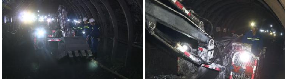
Baggerlader AM45 (vinacomin)

Nach dem Umbau und der Überarbeitung des Baggerladers AM45 auf dem Bergwerk der Uong Bi Coal stieg die monatliche Auffahrleistung von 80 m mit neun Bergleuten je Schicht auf 200 bis 220 m mit vier bis fünf Bergleuten je Schicht.