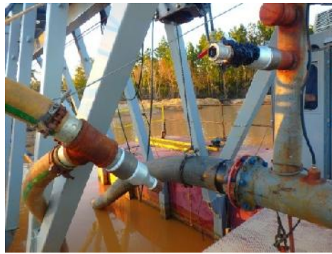
Geplatzte 2" Verbindung (msha)

Ein ukrainischer Geologe wurde bei Untersuchungsarbeiten im Auftrag der Firma Sai-Aska LLC in einem Kohletagebau in Besh-Terek in Kirgistan durch Steinfall getötet.