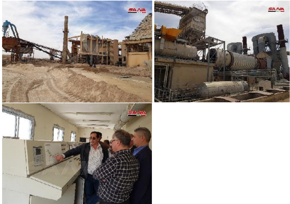
Anlage al-Sharqiya (SANA)

Die durch den Terror des IS zerstörten Phosphataufbereitungen Khneifis und al-Sharqiya in der Wüste Palmyra Badiya sind zu 70% wieder aufgebaut. Die Arbeiten werden komplett von einheimischen Firmen ausgeführt.