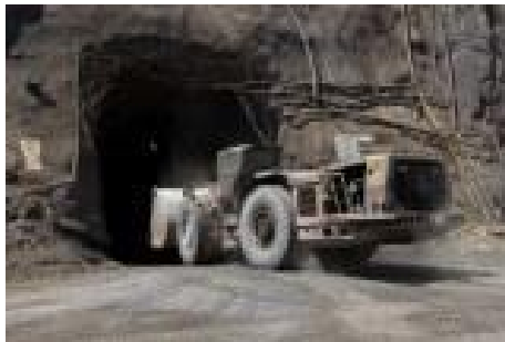
Bergwerk Cosmo (ABC Rural)