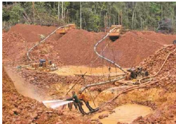
Goldgewinnung mit Wasser

Bei Baumfällarbeiten am Rande eines Goldtagebaus in Kumung Backdam in Guyana fiel ein Baum in den Tagebau und erschlug einen Bergmann.