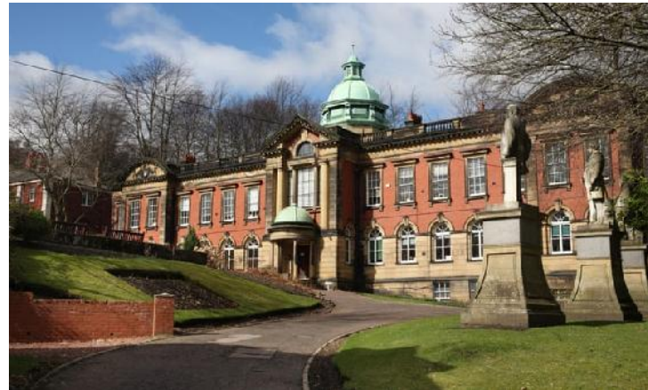
Redhills „Pitman’s Parliament“

Vor mehr als 100 Jahren beschlossen die Bergleute der Grafschaft Durham ein eigenes Gebäude für die Gewerkschaft zu errichten. 1915 wurde Redhills feierlich von Edward, Prince of Wales eröffnet. Das mit dem Spitznamen „Pitman’s-Parlament“ belegte Gebäude ähnelte dem Landgut eines Bergwerkbesitzers und war ein einzigartiges und außergewöhnliches Denkmal für den Stolz, Ehrgeiz und Selbstorganisation der Arbeiterklasse. 1993 schloss das letzte Bergwerk in Durham und das Gebäude verfiel, obwohl unter Denkmalschutz gestellt und trotz Veranstaltungen. Jetzt hat der National Lottery Fund eine erste Rate von 441.000 Euro für die auf 4,4 Mio. Euro geschätzte Renovierung übergeben.