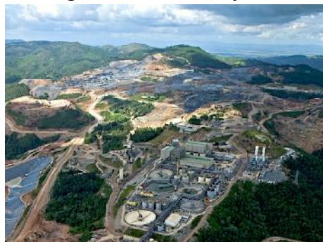
Tagebau Pueblo Viejo (Barrick Gold)