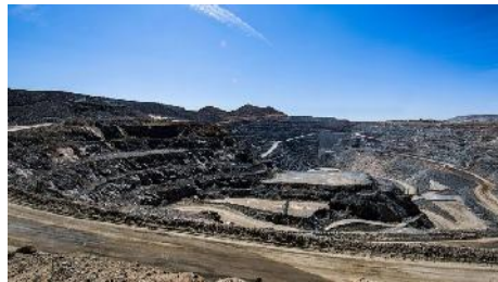
Goldtagebau San Francisco (SteelGuru)