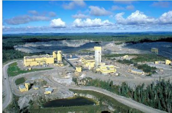
Goldbergwerk Hemlo

Der australische Bergbaudienstleister Barmenco hat von Barrick Gold den Auftrag erhalten, Streckenvortrieb, Abbau und Transport auf dem Goldbergwerk Hemlo durchzuführen. Der Vertrag beginnt im April 2020, läuft über drei Jahre und hat ein Volumen von 175 Mio. Euro. Es sollen mehr als 300 Mitarbeiter beschäftigt werden. Die Ausrüstung wird von Barrick gestellt.