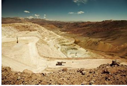
Tagebau Paracatu (BMAmericas)