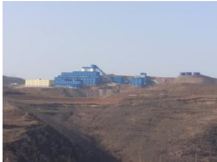
Bergwerke Ying und