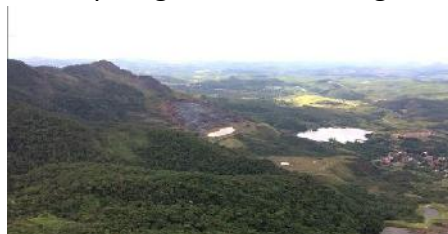
Tagebau Sao Luiz