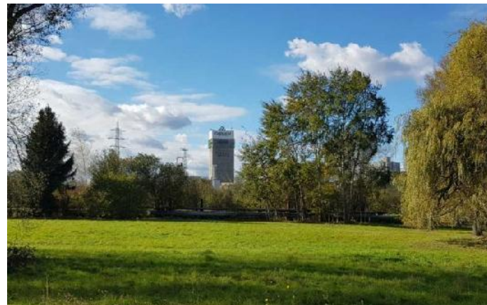
Bergwerk Darkov (OKD)

Die OKD hat für 2020 eine Förderung von 3,7 Mio. t geplant. Dabei sollen die Kosten gesenkt und die einzelnen Produktionsprozesse rationalisiert werden. Ein positives Ergebnis wird nicht erwartet.