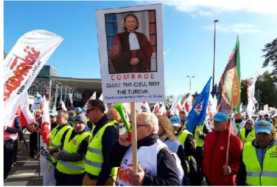
Polnische Bergleute in Luxemburg (nettg)

Mehr als 2.000 polnische Bergleute protestierten in Luxemburg gegen die Entscheidung des Gerichtshofs der Europäischen Union die Förderung auf dem Braunkohletagebau Turow einzustellen.