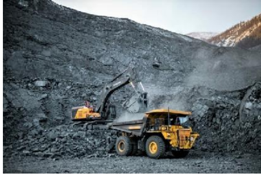
Goldtagebau Neschdaninskaja

JSC Polymetal hat den Goldtagebau Neschda auf der Lagerstätte Neschdaninskaja in Jakutien in Förderung genommen. 38 Monate dauerte der Bau des Tagebaus und der Aufbereitung. Bis Ende April 2022 soll der Tagebau seine geplante Kapazität von 2 Mio. t Erz und einer Goldproduktion von 5,6 t erreicht haben. In den nächsten 24 Jahren sollen insgesamt 137 t Gold produziert werden.