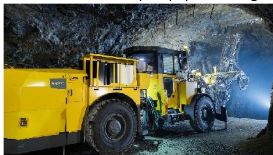
Boltec mit Harzpumpensystem (epiroc)

Epiroc von der LKAB hat einen Großauftrag zur Lieferung von Bohrwagen der Typen Boomer, Boltec und Simba für die Eisenerzbergwerke Malmberget und Kiruna erhalten. Der Auftrag hat einen Wert von 10,5 Mio. Euro. Alle Geräte sind mit der neuesten Automatisierung ausgerüstet. Die Simba-Bohrwagen werden von einem Kontrollraum aus ferngesteuert, ein Boltec-Bohrwagen ist mit dem neuen Harzpumpensystem ausgestattet.