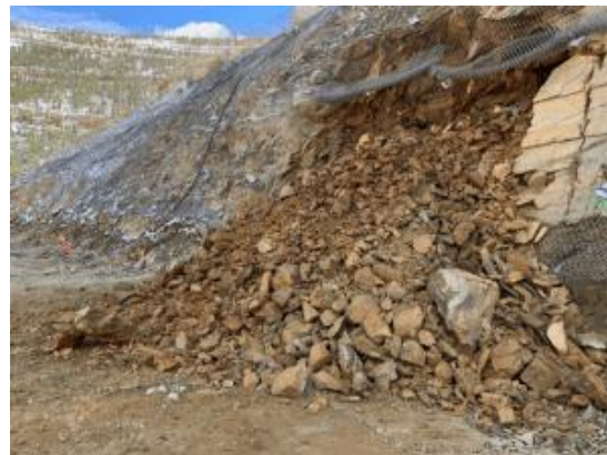
Erster Abschlag (jervois)

Die australische Jervois hat mit dem Bau des Kupfer-Kobalt-Goldbergwerks (Idaho cobalt project) begonnen.