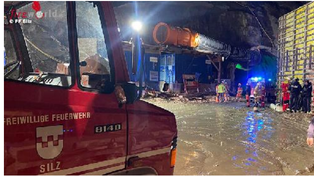
Stollen Kühtai (fireworld)

Bei einer Explosion im Stollenvortrieb auf der Kraftwerksbaustelle Kühtai in Tirol wurde ein Mineur getötet. Er hatte beim Bohren für den neuen Abschlag einen stehengebliebenen Schlag angebohrt.