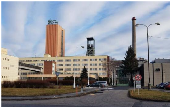
Bergwerk CSM-Sever (okd)

Die OKD hat in den ersten neun Monaten mit 1,6 Mio. t 10% mehr Kokskohle gefördert als geplant. Während 2020 der Preis für eine Tonne 86 Euro betrug, sind es aktuell 344 Euro. Der Umsatz erreichte 214,63 Mio. Euro. Dies ist mehr als für das komplette Jahr 2021 geplant war.