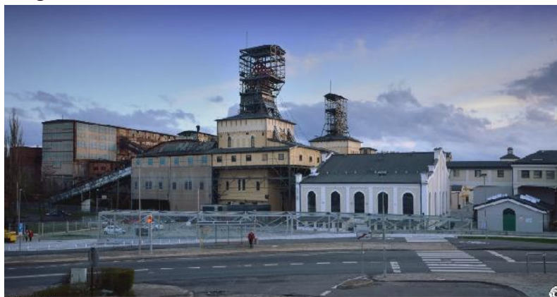
Old Mine Multicultural Park (polska-org)

Vor 25 Jahren, am 31. Oktober 1996, wurde auf dem Bergwerk ZG Julia im niederschlesischen Kohlerevier Waldenburg der letzte Wagen gezogen und damit die Kohleförderung in diesem Revier beendet. 2009 wurde das Bergwerk zum Old Mine Multicultural Park umbenannt und zum Besucherbergwerk hergerichtet.