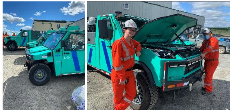
Rokion R100 und R400 (evolutin mining)

Evolution Mining hat nach dem Test acht batteriebetriebene Rokion-Fahrzeuge vom Typ R100 und R400 gekauft.