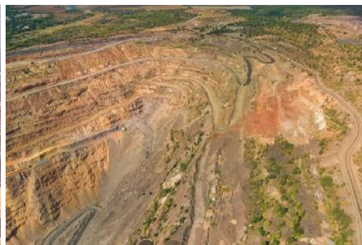
Tagebau Ingulets (nettg)