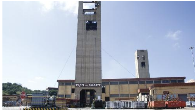
Goldbergwerk Kusasaletu (creamer)

Auf dem südafrikanischen Goldbergwerk Kusasaletu von Harmony Gold wurden bei einem Gebirgsschlag zwei Bergleute getötet. Das Bergwerk baut in einer Teufe von 3.388 m das Ventersdorp-Riff.