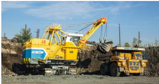
Bagger EKG-12K (0564.ua)

Die zur Metinvest gehörende SevGOK hat für den Eisenerztagebau Perwomajskaja einen neuen 12 m 3 -Bagger EKG-12K für 5,46 Mio. Euro gekauft. In den letzten drei Jahren wurden bereits sieben Bagger vom gleichen Typ gekauft.