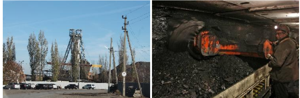
Bergwerk Dalnjaja

Im Revier Rostow wird das Anthrazitbergwerk Dalnjaja von Donskoy Anthracite mit dem gestundeten Anthrazitbergwerk Nr. 410 untertägig verbunden. Der Wetterschacht von Nr. 410 wird modernisiert und bekommt einen neuen Grubenlüfter, die untertägige Sprengstoffkammer wieder in Betrieb genommen und der Ostschacht und der westliche Schrägschacht des Bergwerks Nr. 410 repariert und in Betrieb genommen. Unter Tage werden die Wetterführung, das Grubenwasser- und Frischwassersystem und der Transport zusammengeführt. Die Fördermenge soll von 930.000 t auf 1,5 Mio. t gesteigert werden. Mit der Zusammenlegung wird das Westfeld erschlossen. Die Flözmächtigkeit beträgt hier 1,0 bis 1,2 m. Das Projekt wurde von SPB Giproshacht geplant und soll bis Ende 2021 abgeschlossen sein.