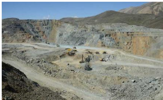
Goldtagebau Sotk