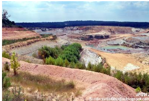
Tagebau Harrison (basf)

BASF hat seine Kaolintagebaue und Verarbeitungsbetriebe in Central Georgia an die KaMin LLC verkauft. Die Betriebe haben 500 Mitarbeiter und hatten 2020 einen Umsatz von 155 Mio. Euro erwirtschaftet.