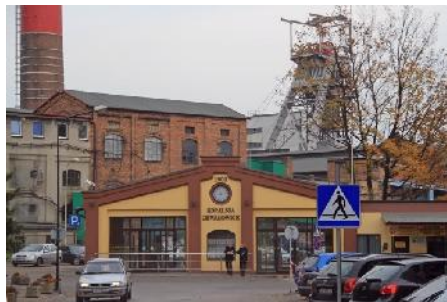
KWK Chwałowice

Auf dem australischen Kokskohletagebau Curragh von Coronado Global Resources wurde ein Bergmann des Bergbaudienstleisters Thies beim Wechseln eines Reifens von einem Muldenkipper getötet.