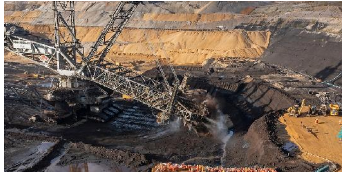
Bagger 289 (mha)

RWE Power montiert derzeit das neue Aufnahmegerät AG 820, das den Löss aus dem Lössbunker auf ein Förderband lädt. Ab April 2022 sollen jährlich 1 Mio. m 3 Löss umgeladen und transportiert werden. Der AG 820 hat ein Schaufelrad mit einem Durchmesser von 8,40 m.