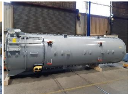
neue Mühle (STM)