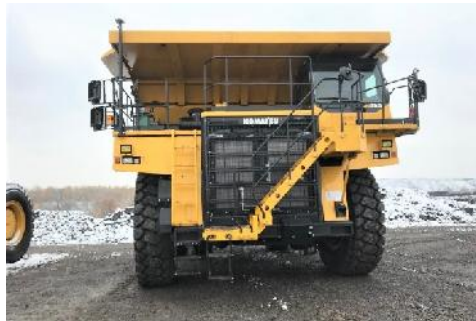
Komatsu HD785 (stroijserwis)

Im Kohletagebau Severni Maganak von Stroijserwis wurden zwei neue Muldenkipper vom Typ Komatsu HD785 in Betrieb genommen. Die 1.178 PS Kipper haben eine Nutzlast von 90 t.