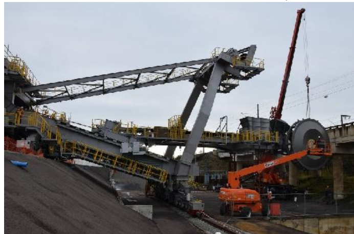
Neuer Aufnahmebagger (mha)

RWE Power montiert derzeit das neue Aufnahmegerät AG 820, das den Löss aus dem Lössbunker auf ein Förderband lädt. Ab April 2022 sollen jährlich 1 Mio. m 3 Löss umgeladen und transportiert werden. Der AG 820 hat ein Schaufelrad mit einem Durchmesser von 8,40 m.