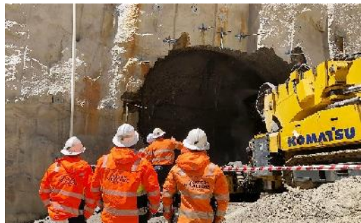
Schrägschacht (master builders)

Während der Auffahrung des Schrägschachtes auf dem Kupferbergwerk Kanmantoo von Hillgrove Resources mit dem Komatsu MC51 werden 10,9 m lange Selbstbohranker eingesetzt. Diese werden mit dem MasterRoc RBA 380 Ankerkunstharz von Master Building Solutions verpresst. Das Harz reagiert innerhalb von 3 Minuten.