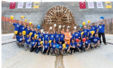
Durchschlag (tunneling journal)