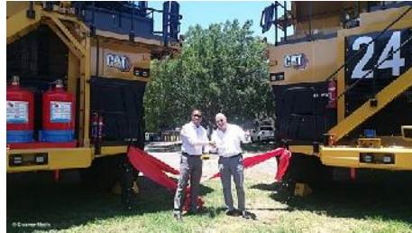
Übergabe CAT 785D (barloworld)

Barloworld Equipment South Africa hat zwei Muldenkipper vom Typ CAT 785D an den Platinbergmann Tharisa für seinen Tagebau in Rusten übergeben.