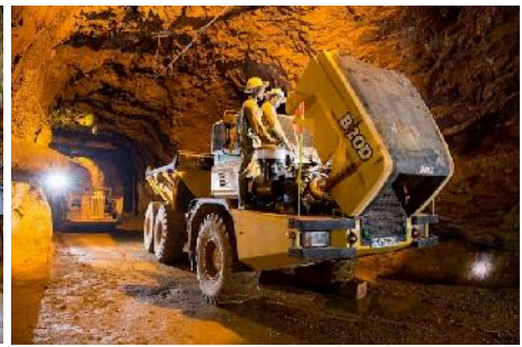
Hauptwasserhaltung auf der 1.200 m-Sohle Fahrzeuge auf der 1.200 m-Sohle (ivanhoe)