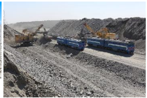
Dieselloks 2TE25 KM (nmmc)