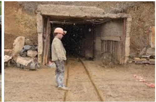
Goldbergwerk Meghradzor (factor)

Ab 2025 will die russische GeoProMining den Goldtagebau Sotk um ein untertägliches Bergwerk erweitern und dort jährlich über eine Betriebsdauer von 25 Jahren 400.000 t Roherz fördern.