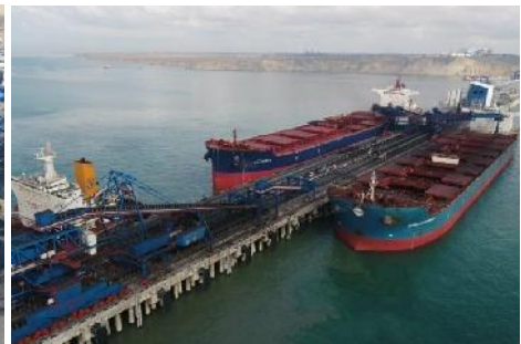
Kohleterminal Taman (cdnimg)

Im Kohletagebau Severni Maganak von Stroijserwis wurden zwei neue Muldenkipper vom Typ Komatsu HD785 in Betrieb genommen. Die 1.178 PS Kipper haben eine Nutzlast von 90 t.