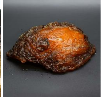
Bernstein 5.305 g