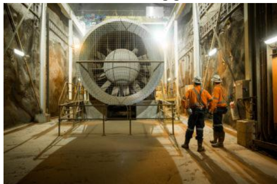
Lüfter mit einem Durchmesser von 3,8 m (oz minerals)

Für 530 Mio. Euro erweitert das Bergbauunternehmen OZ Minerals das Kupfer-Goldbergwerk Prominent Hill. Dazu wird der 1.329 m tiefe Förder-schacht Wira mit einem Durchmesser von 7,5 m abgeteuft. Der Vorschacht mit einer Teufe von 93 m wird mit einer Schachtfräse von Herrenknecht geteuft. Nach dem Niederbringen einer Pilotbohrung wird der Schacht im Raisebore-Verfahren erweitert. Die Firma Zitron Australia Pty. Ltd. wird für die Erweiterung das Bewetterungssystem planen und fertigen. Wenn die neuen Ventilatoren in Betrieb sind, steigt die Lüfterleistung auf 8,6 MW. Seit 2014 liefert Zitron die untertägigen Ventilatoren an das Bergwerk Prominent Hill.