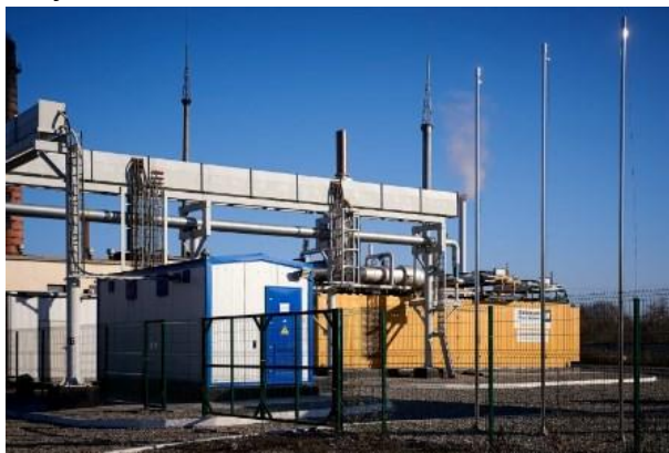
Grubengassauger und BHKW (dtek)

DTEK Energy hat im vergangenen Jahr 1,3 Mio. m 3 Grubengas aus dem Bergwerk Stepova verwertet und 6 Mio. kW/h Strom und Wärme für den Eigenbedarf erzeugt. Recycling Solutions hat insgesamt 2,3 Mio. Euro in das Projekt investiert.