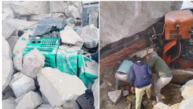
Bilder vom Unglücksort

Mehrere Stunden nach einer Sprengung im Gesteinstagebau Dadam im indischen Distrikt Bhiwani kam es zu einer 30 m breiten Böschungsrutschung. Die Gesteinsmassen begruben mehrere Bagger und LKW mit ihren Fahrern die bereit standen um mit dem Laden zu beginnen. Bisher wurden vier Bergleute tot geborgen.