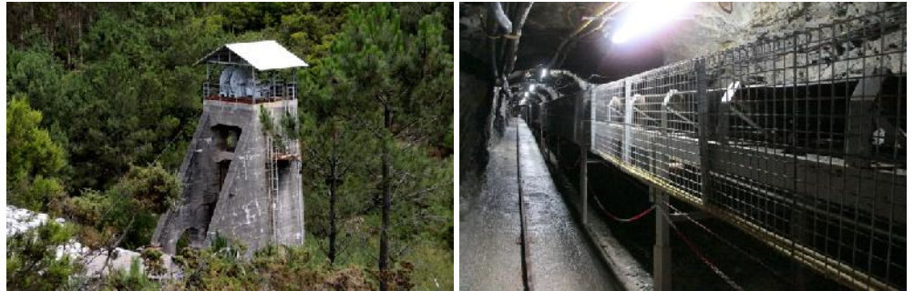
Bergwerk San Finx (valoriza)

Die australische Rafaella Resources hat von der Valoriza Minería das Zinn-Wolframbergwerk San Finx gekauft. Das Bergwerk war von 1884 bis 1990 in Förderung. Die Bergbauberechtigung ist bis 2068 gültig. Valoriza hat einen neuen Schrägschacht aufgeföhren, das Bergwerk elektrifiziert, eine neue Fördermaschine montiert und eine Bandanlage eingebaut.