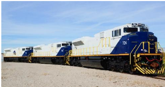
Loks von Progress Rail (prograssrail)

Fortescue Metals Group hat zwei batteriebetriebene Lokomotiven von Caterpillar bestellt. Die 14,5 MWh-achtachsigen Lokomotiven werden im Caterpillar Werk Progress Rail im brasilianischen Cet Lagoas gefertigt. Die erste Lok soll 2023 ausgeliefert werden.