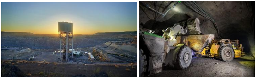
Bergwerk Ernest Henry (north west star)

Glencore hat das Kupfer-Goldbergwerk Ernest Henry an die Evolution Mining für 642 Mio. Euro verkauft. Glencore wird das komplette Kupferkonzentrat kaufen.