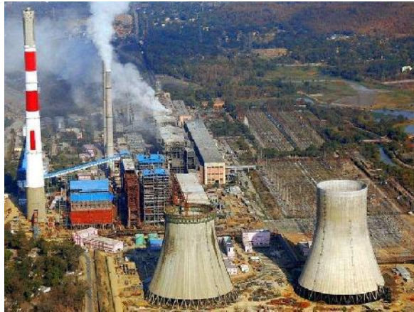
Singareni Kraftwerk

Ducon Infratechnologies hat von der Singareni Collieries den Auftrag zur Lieferung einer Rauchgasentschwefelungsanlage für das 1.200 MW Kohlekraftwerk in Telangana erhalten. Das Kraftwerk ist seit 2016 in Betrieb.