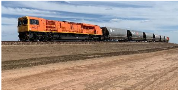
Bowen Rail Lokomotive (rail express)

Bravus Mining & Resources hat die erste Kohle aus dem Tagebau Carmichael zum North Queensland Export Terminal (NQXT) in Bowen geliefert. Die Kohle wurde während der Inbetriebnahme der neuen Züge der Bowen Rail Company geliefert.