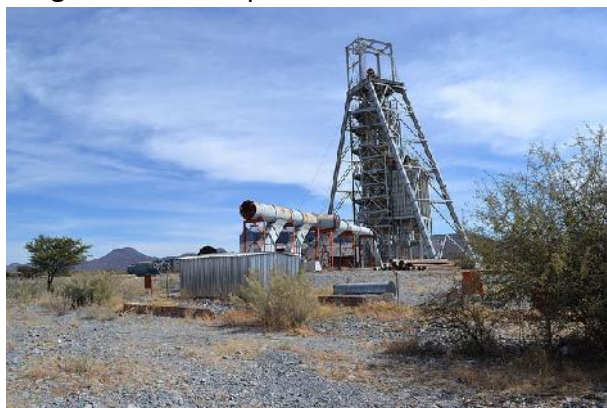
Bergwerk Kombat (trigonmetals)

Trigon Metals hat das erste Kupfer und Silber aus dem wieder angefahrenen Bergwerk Kombat produziert.