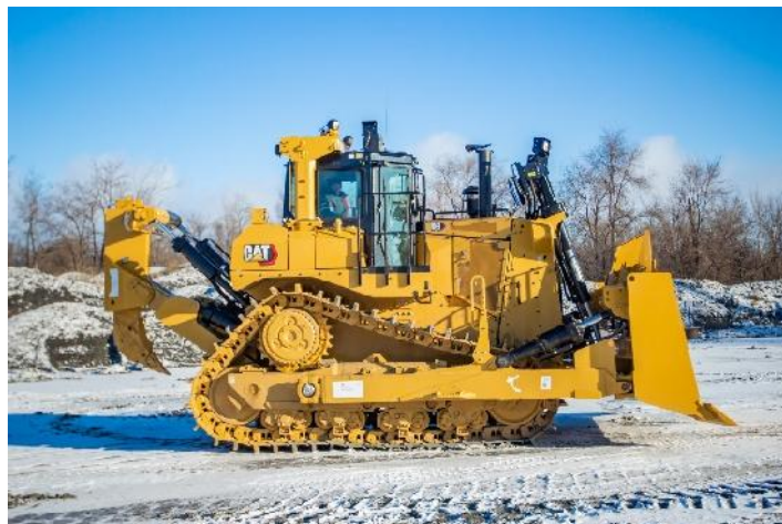
Cat D9R (metinvest)