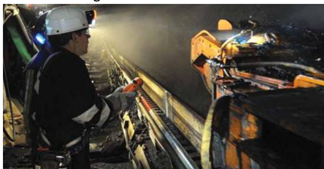
Cumberland Streb (womp-int)

Iron Senergy hatte am 10. Dezember 2020 das Strebbergwerk Cumberland von Contura Energy übernommen. Das Bergwerk hat 500 Mio. t abbaubare Vorräte in Flöz Pittsburgh 8. Für dieses Jahr ist mit 700 Beschäftigten eine Förderung von 6 Mio. t verkaufsfähige Kohle geplant. Im jetzigen Grubenfeld können die Bauhöhen 73, 74 und 75 gebaut werden. Derzeit ist Bauhöhe 73 in Verhieb. Alle Bauhöhen haben eine Streblänge von 420,6 m und eine Baulänge von 3.353 m. Die anschließende Bauhöhe 76 hat eine Baulänge von 4.572 m bei einer Streblänge von 482 m.