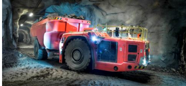
Toro TH663i (solid ground)

Sandvik Mining and Rock Solutions hat den bisher größten Auftrag für ihr AutoMine erhalten. Der Auftraggeber ist die staatliche Codelco. Darüber hinaus liefert Sandvik bis zu 32 Maschinen der Typen Toro TH663i Muldenkipper und Sandvik LH514 LHD. Beide Aufträge sind für das Kupferbergwerk El Teniente. Der AutoMine Auftrag hat einen Wert von 24,4 Mio. Euro, der Auftrag für die Fahrzeuge einen von 14,6 Mio. Euro. Der Vertrag beginnt 2022 und läuft bis 2027.